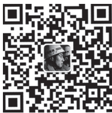
湖南消防官方微信