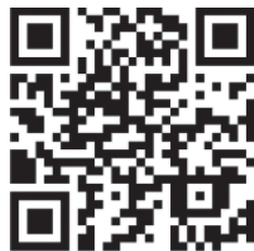
湖南消防官方微博